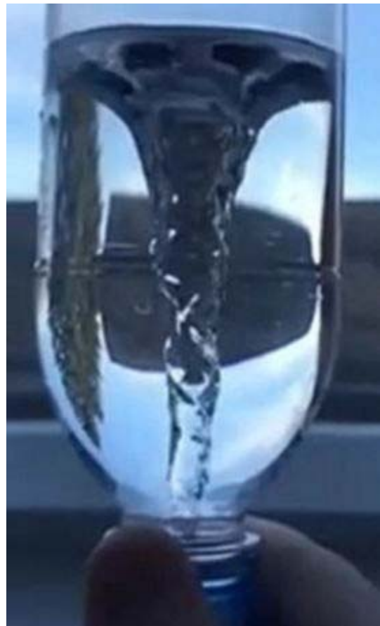
2 Bilder aus dem Video