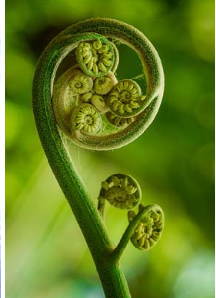
Eingerollte Lebensenergie

"Der Wasserwirbler von Ihnen ist soeben eingetroffen. Freue mich sehr darüber. Einfach toll, diesen Wirbel zu beobachten. Man kann sehr deutlich eine Doppelhelix darin erkennen. Siehe Video: "