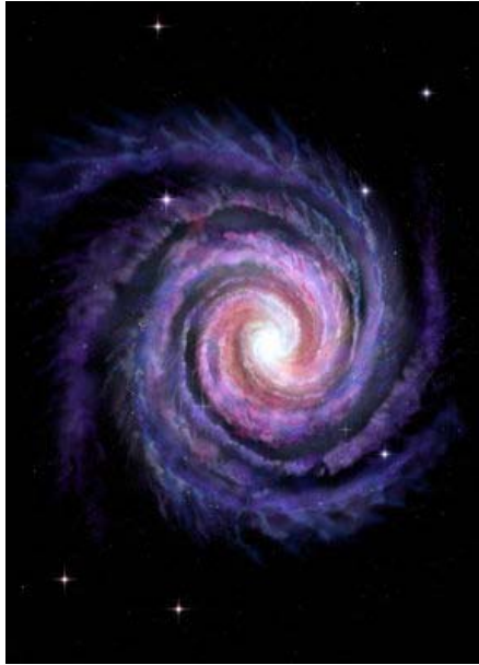
Spiralförmig einrollende Galaxie