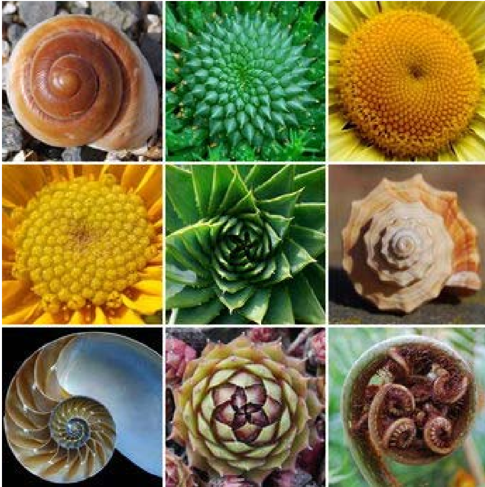
Spiralwirbel - Ordnungsprinzip des Lebens.